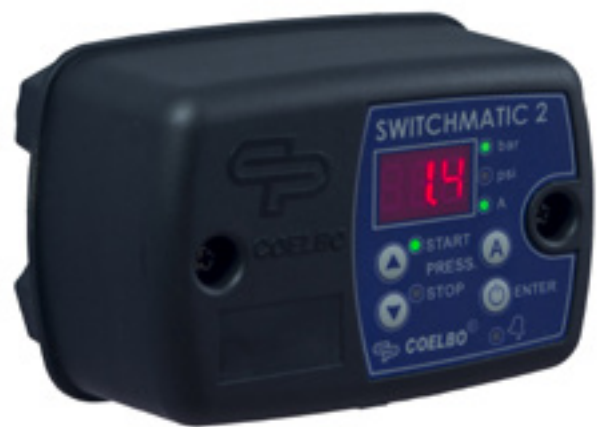
SWITCHMATIC 1 SWITCHMATIC 2 SWITCHMATIC 2/in-out